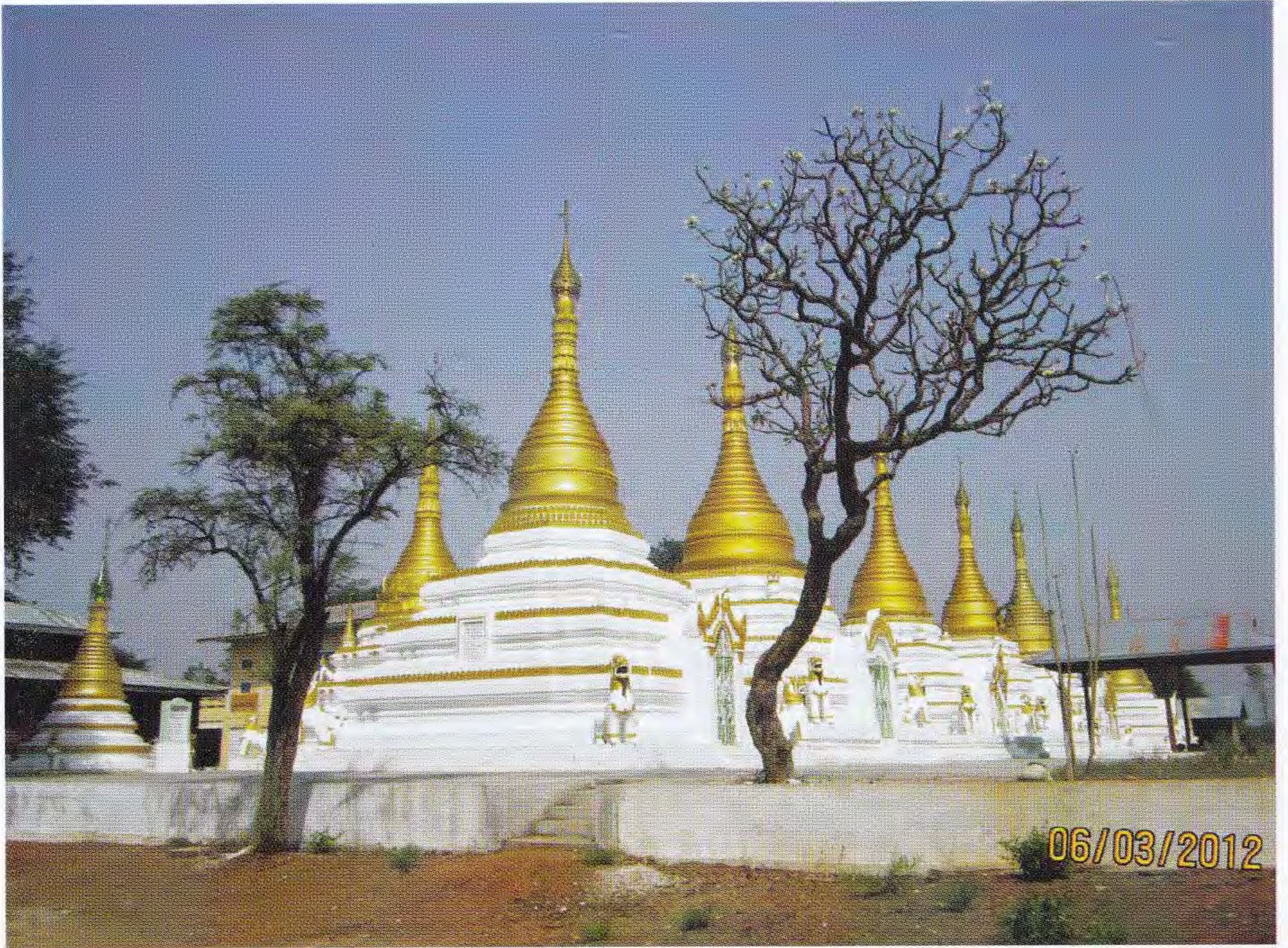
ဆရာတော်ဘုရားကြီး ကိုးလနှင့်အပြီးပြုပြင်ခဲ့သော လင်းယဉ်ရွာဘုရားကုန်းမှ စေတီကိုးဆူ