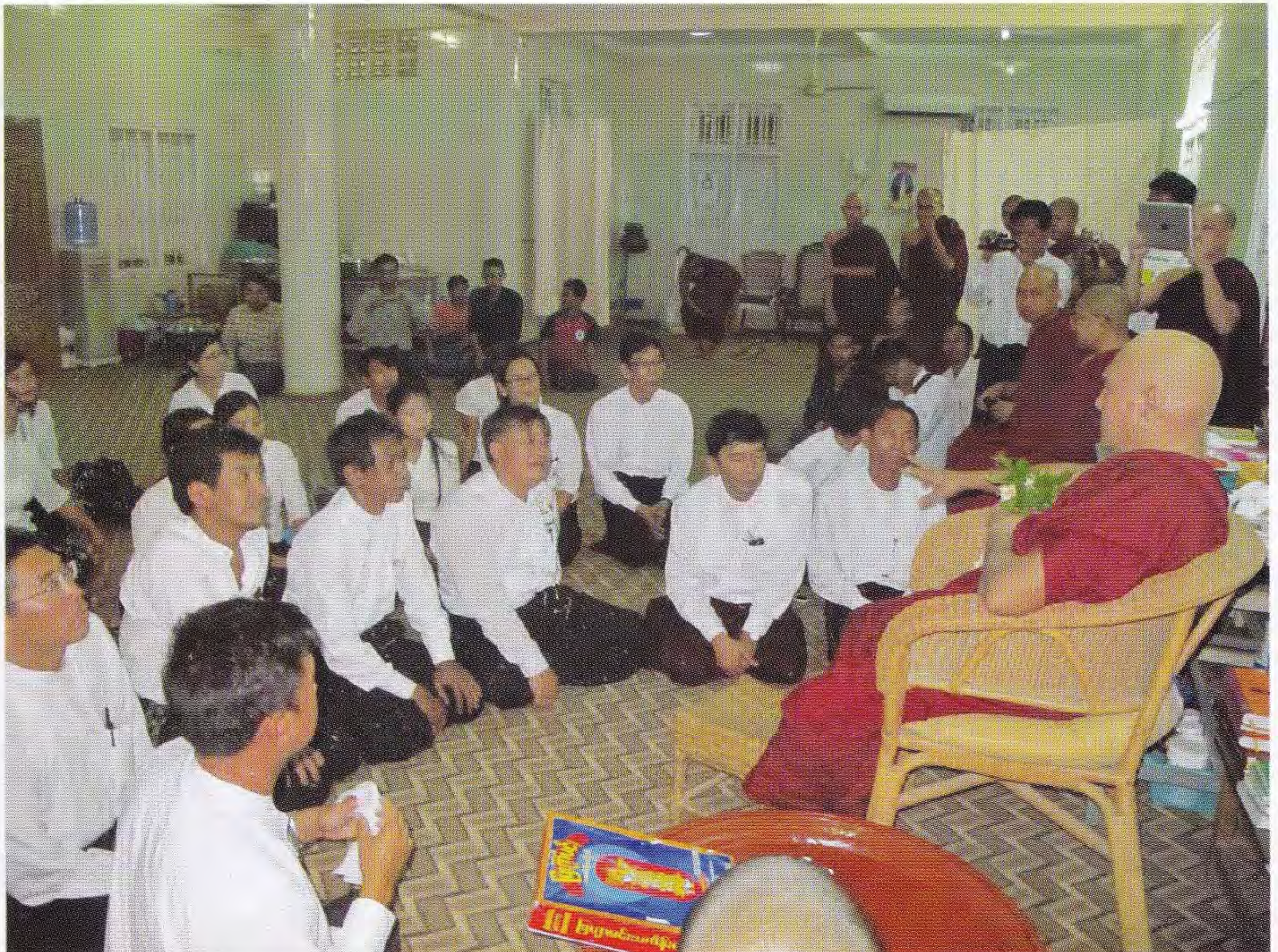
၈၈ မျိုးဆက်ကျောင်းသားခေါင်းဆောင်များ လာရောက်ဖူးမြော်ကြစဉ်