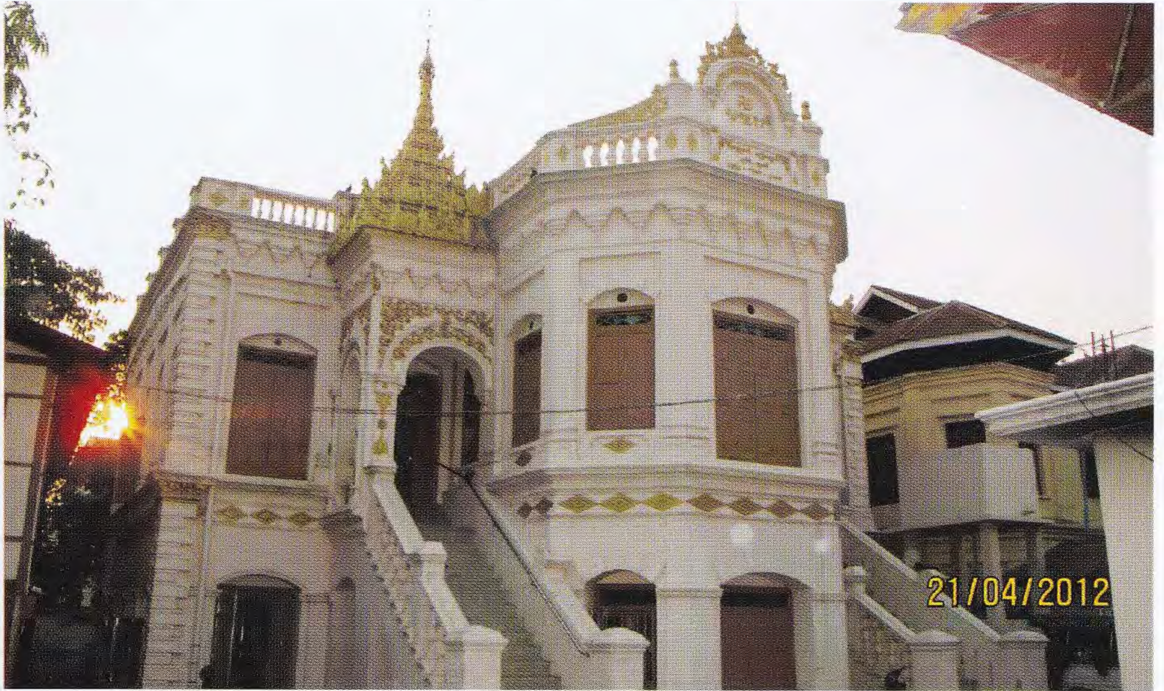
သုဝဏ္ဏဝတီအုတ်ကျောင်း