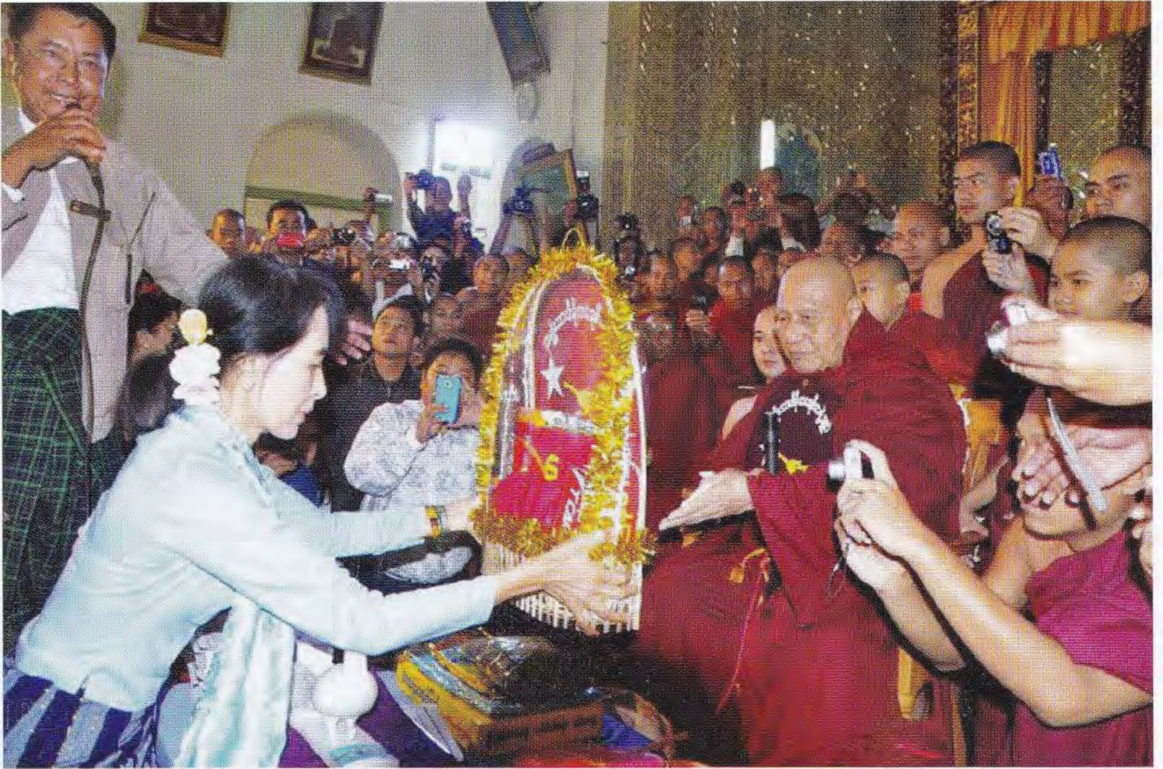
လူထုခေါင်းဆောင် ဒေါ်အောင်ဆန်းစုကြည် လာရောက်ပူဇော်ကန်တော့စဉ်