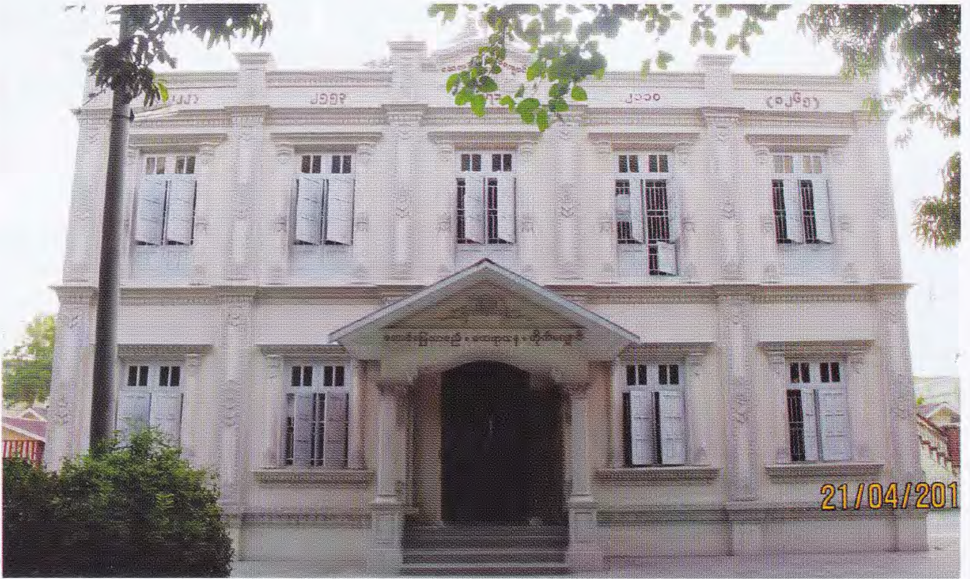
ထေရာသန အုတ်ကျောင်း