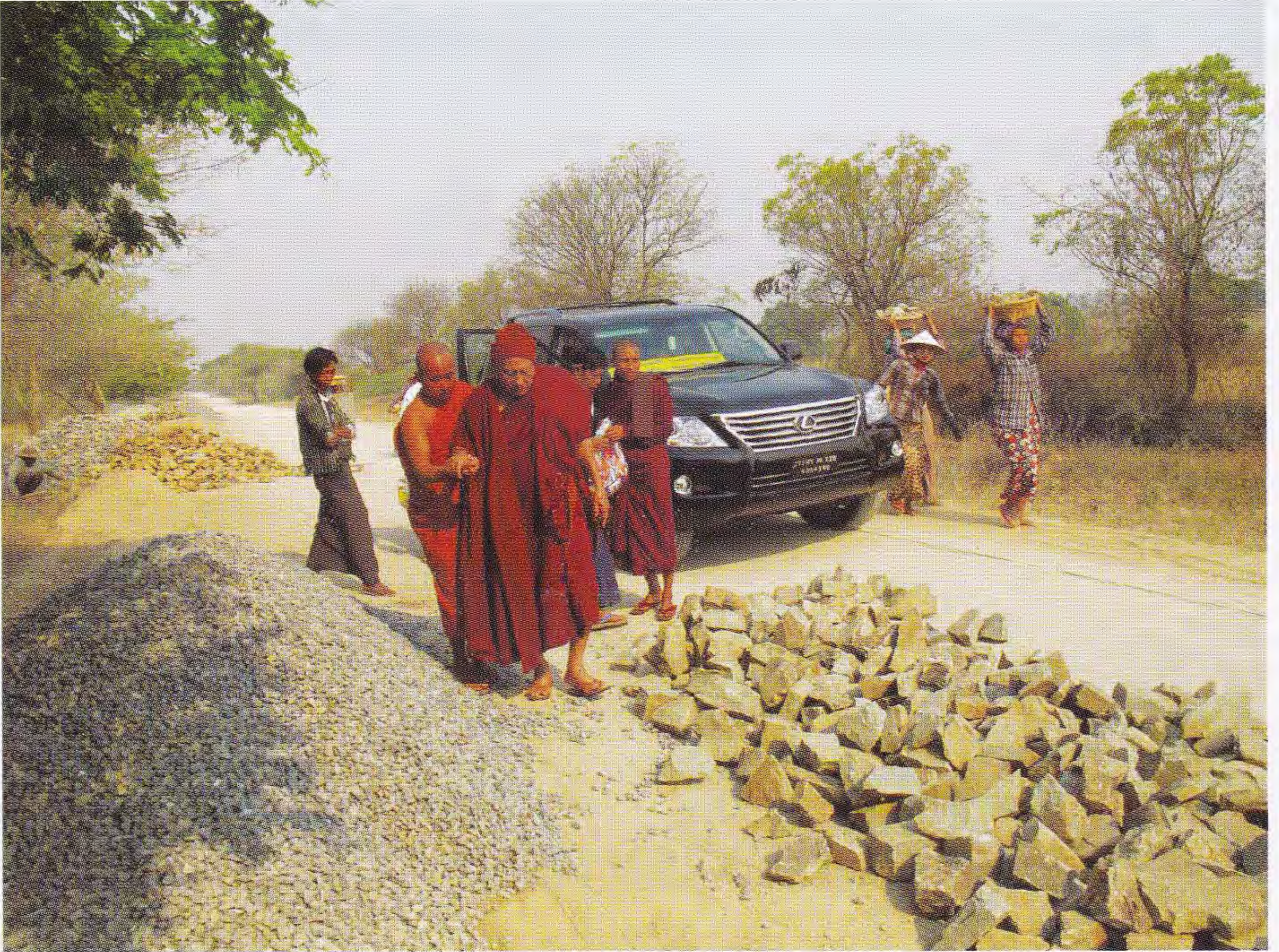
ဆရာတော်ဘုရားကြီး ဦးဆောင်မှုဖြင့် ပြုပြင်ဖောက်လုပ်ဆဲဖြစ်သော ဆားတောင်-လင်းယဉ်ရွာသွား ကတ္တရာကားလမ်းလုပ်ငန်းခွင်အား ဤသို့ ကိုယ်တော်တိုင် ကြည့်ရှုညွှန်ကြား