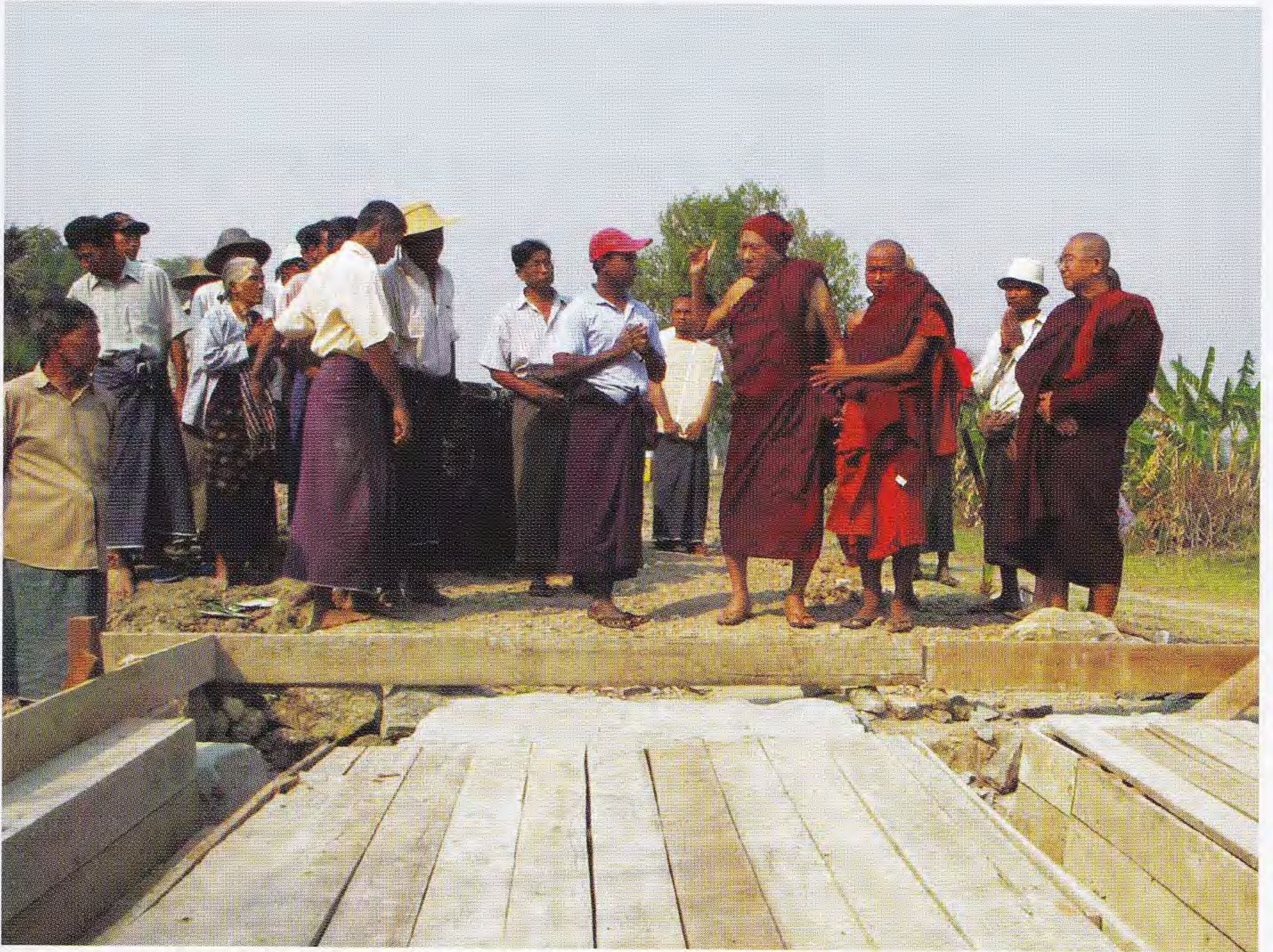
ဆရာတော်ဘုရားကြီး ဦးဆောင်မှုဖြင့် ပြုပြင်ဖောက်လုပ်ဆဲဖြစ်သော ဆားတောင်-လင်းယဉ်ရွာသွား ကတ္တရာကားလမ်းလုပ်ငန်းခွင်အား ဤသို့ ကိုယ်တော်တိုင် ကြည့်ရှုညွှန်ကြား