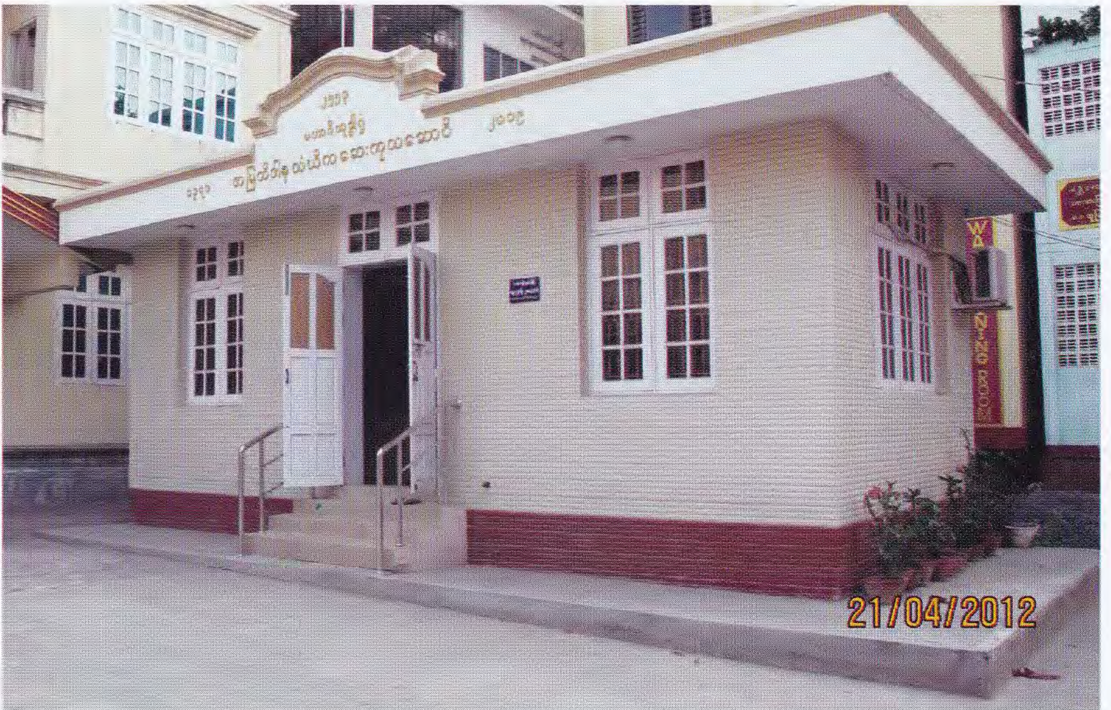
အမြတ်ဒါန သံဃိကဆေးကုသဆောင်