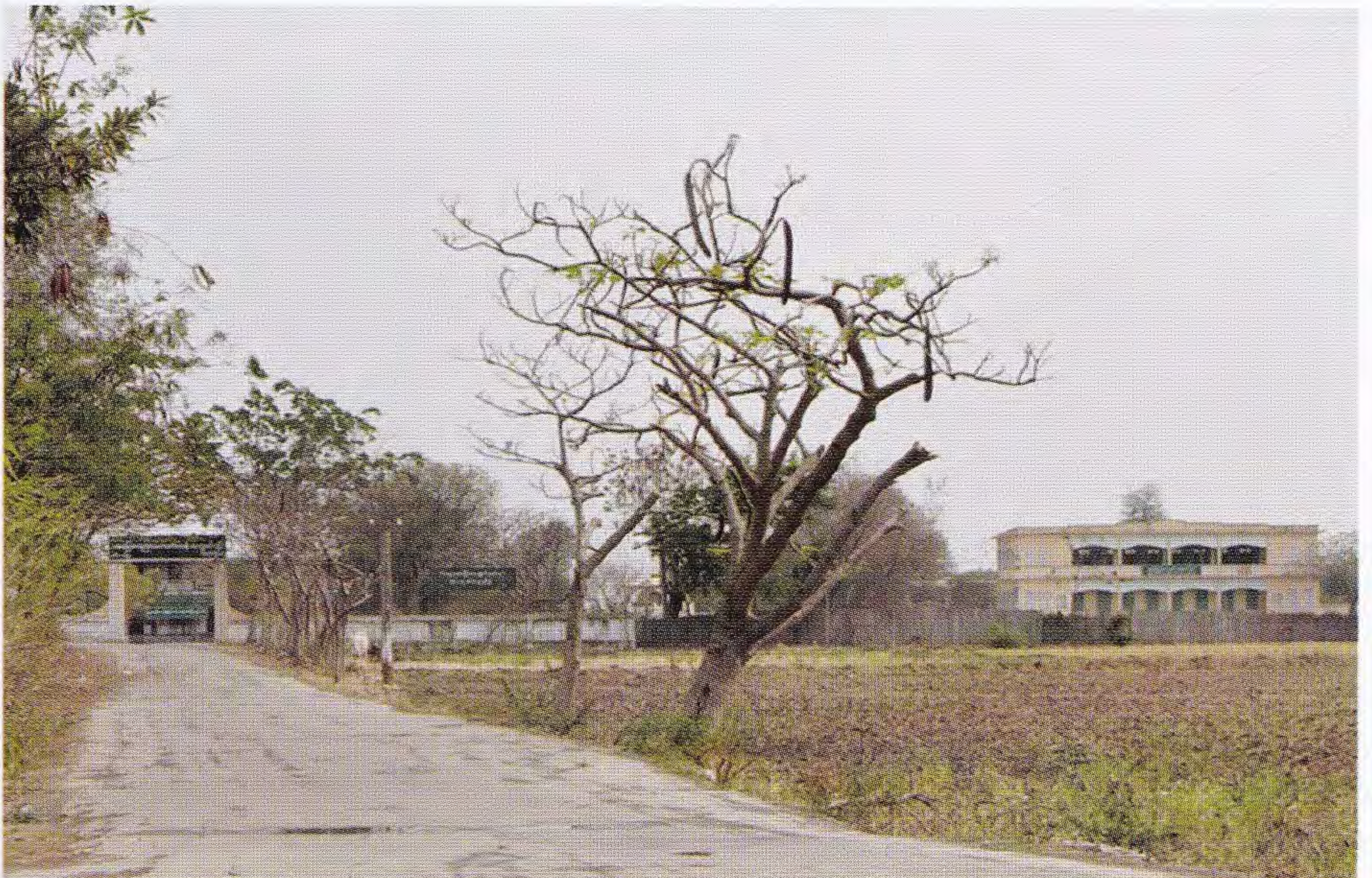
အ-ထ-က ကျောင်းခွဲ လင်းယဉ်ရွာ