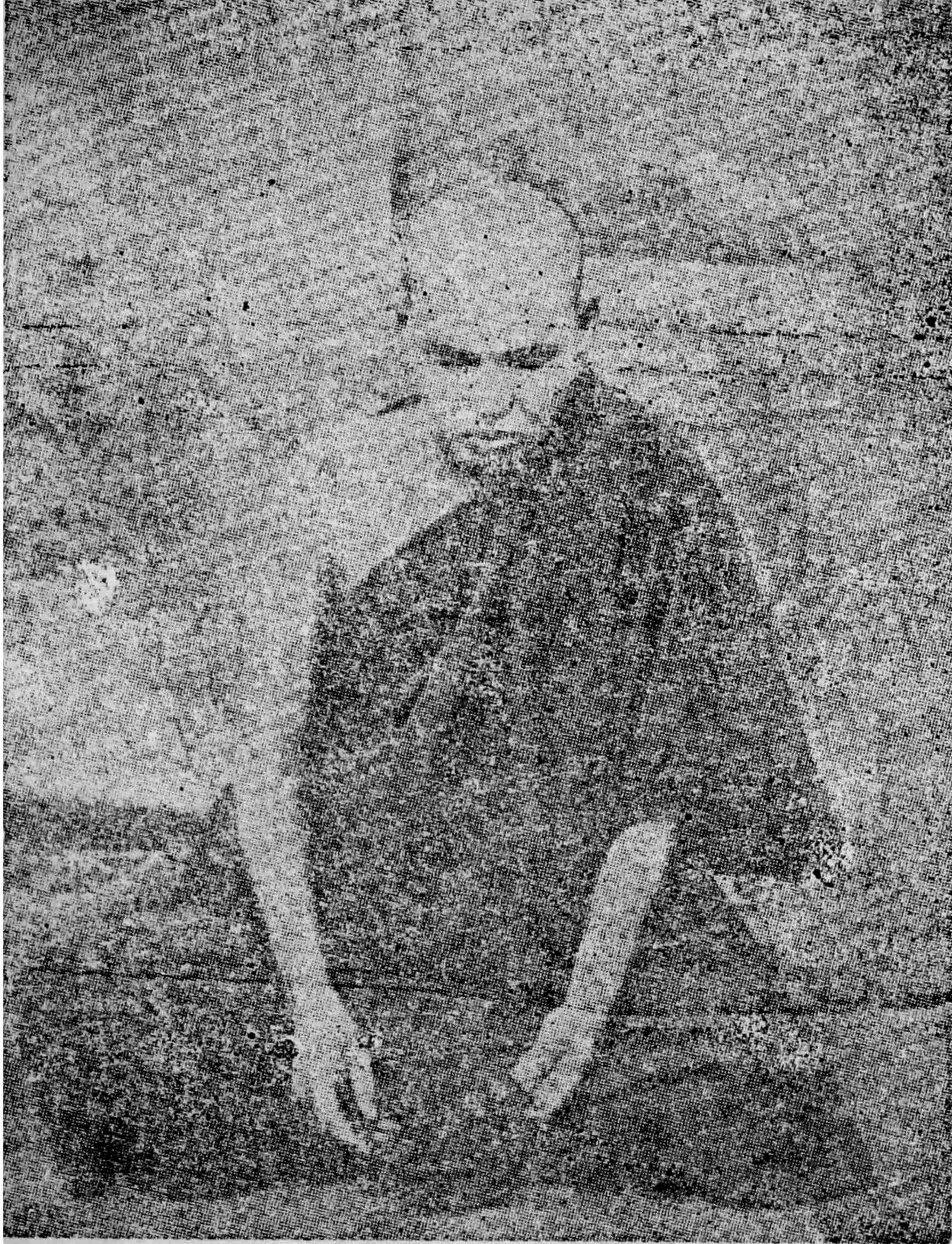
အဂ္ဂမဟာပဏ္ဍိတ နှင့် ဒီလစ် (စာပေပါရဂူ) ဘွဲ့တံဆိပ်တော်ရ လယ်တီဆရာတော်ဘုရားကြီးပုံတော်