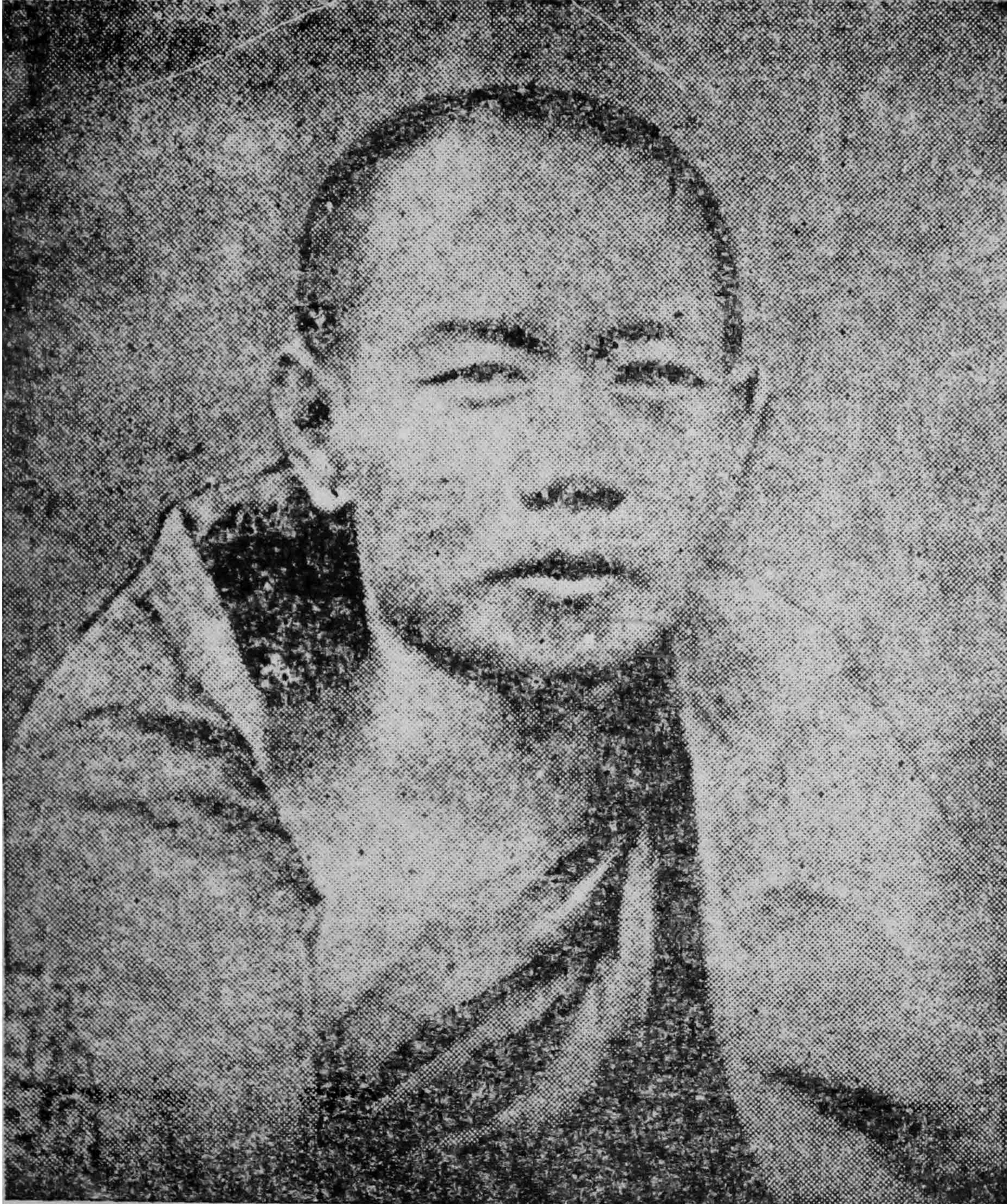
ပဌမ ဓမ္မနာဒ ဆရာတော် ဦးပညာသက္ကမထေရ် ပုံတော် (ခေါ်ပုံ ရိုက်ကူးသောနှစ် ၁၂၉၂-ခု)