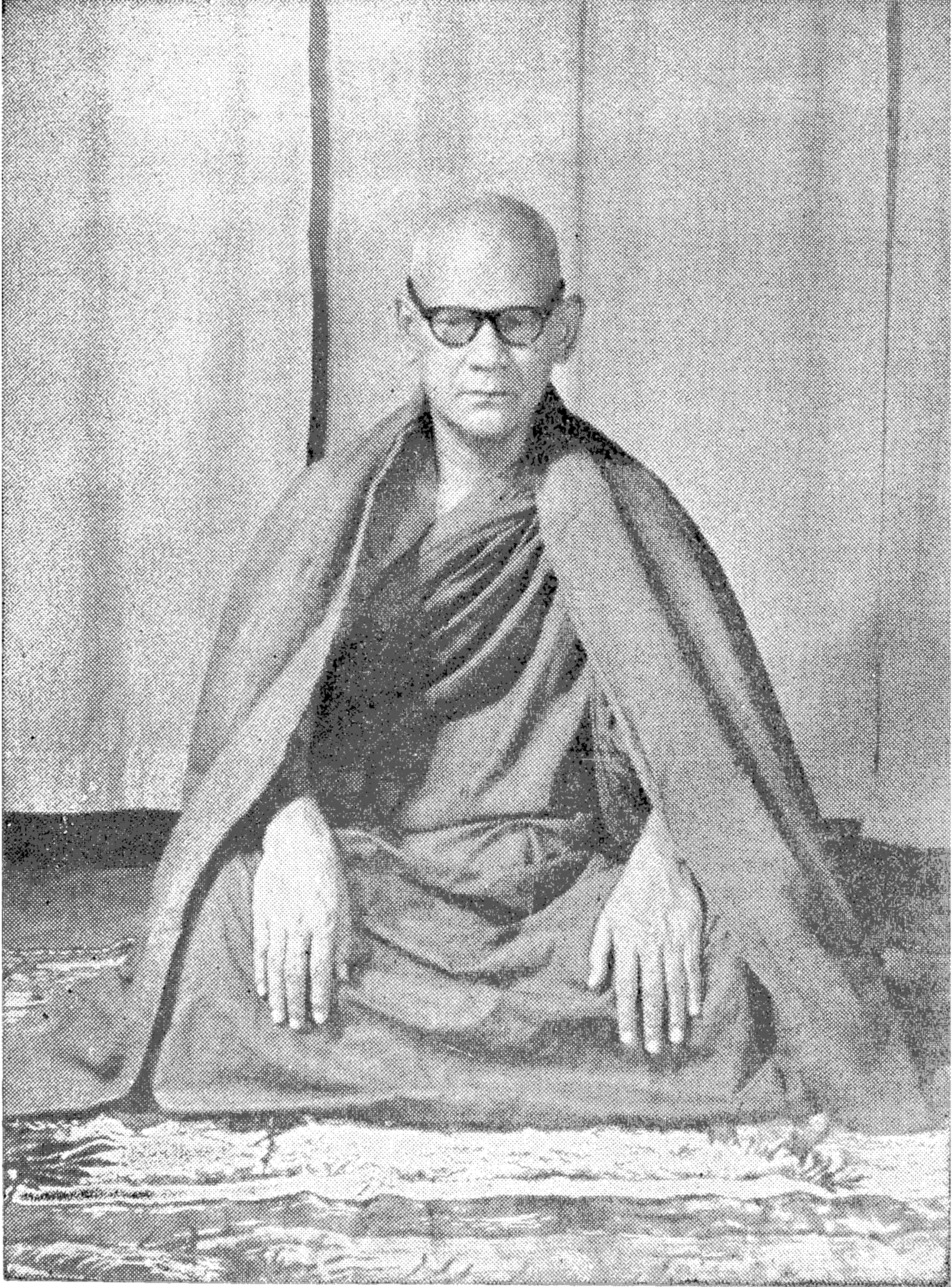
အဂ္ဂမဟာပဏ္ဍိတ မဟာစည်ဆရာတော်