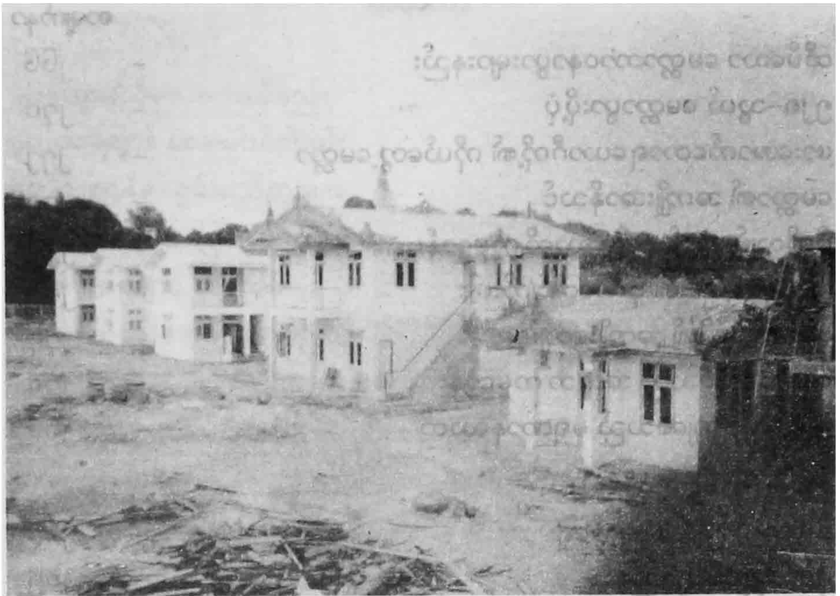
သန်လျင်မြို့၊ ကျိုက်ခေါက်စေတီနှင့် အပြည်ပြည်ဆိုင်ရာ ဗုဒ္ဓသာသနာ့ရိပ်သာ (ဟားအောက်တောရရိပ်သာခွဲ)ရှိ သံဃာဆောင်များနှင့် နှစ်ထပ်သိပ်တော်ကြီး။