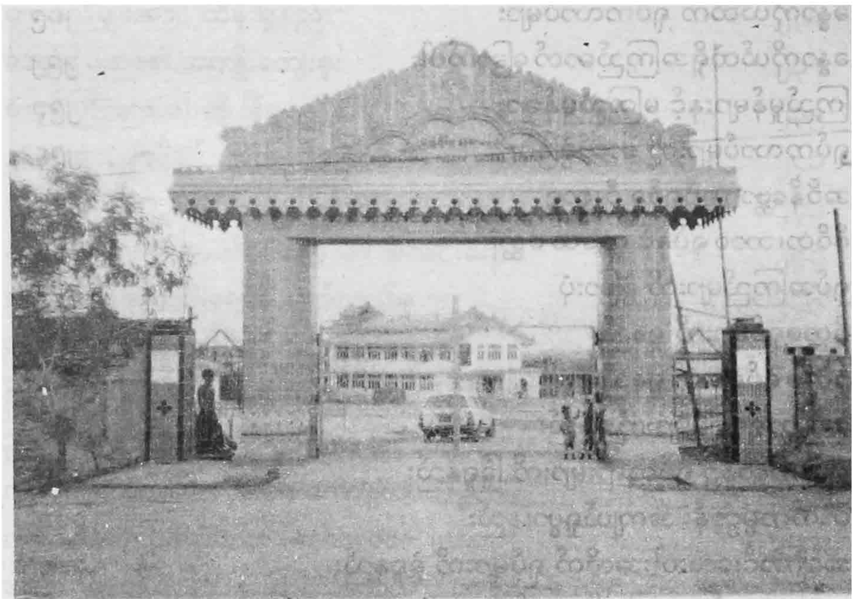
ရန်ကုန်တိုင်း သန်လျင်မြို့ရှိ အပြည်ပြည်ဆိုင်ရာ ဗုဒ္ဓသာသနာ့ရိပ်သာ (ဟားအောက်တောရ ရိပ်သာခွဲ) မုခ်ဦးနှင့် နှစ်ထပ်ဓမ္မာရုံကြီး။