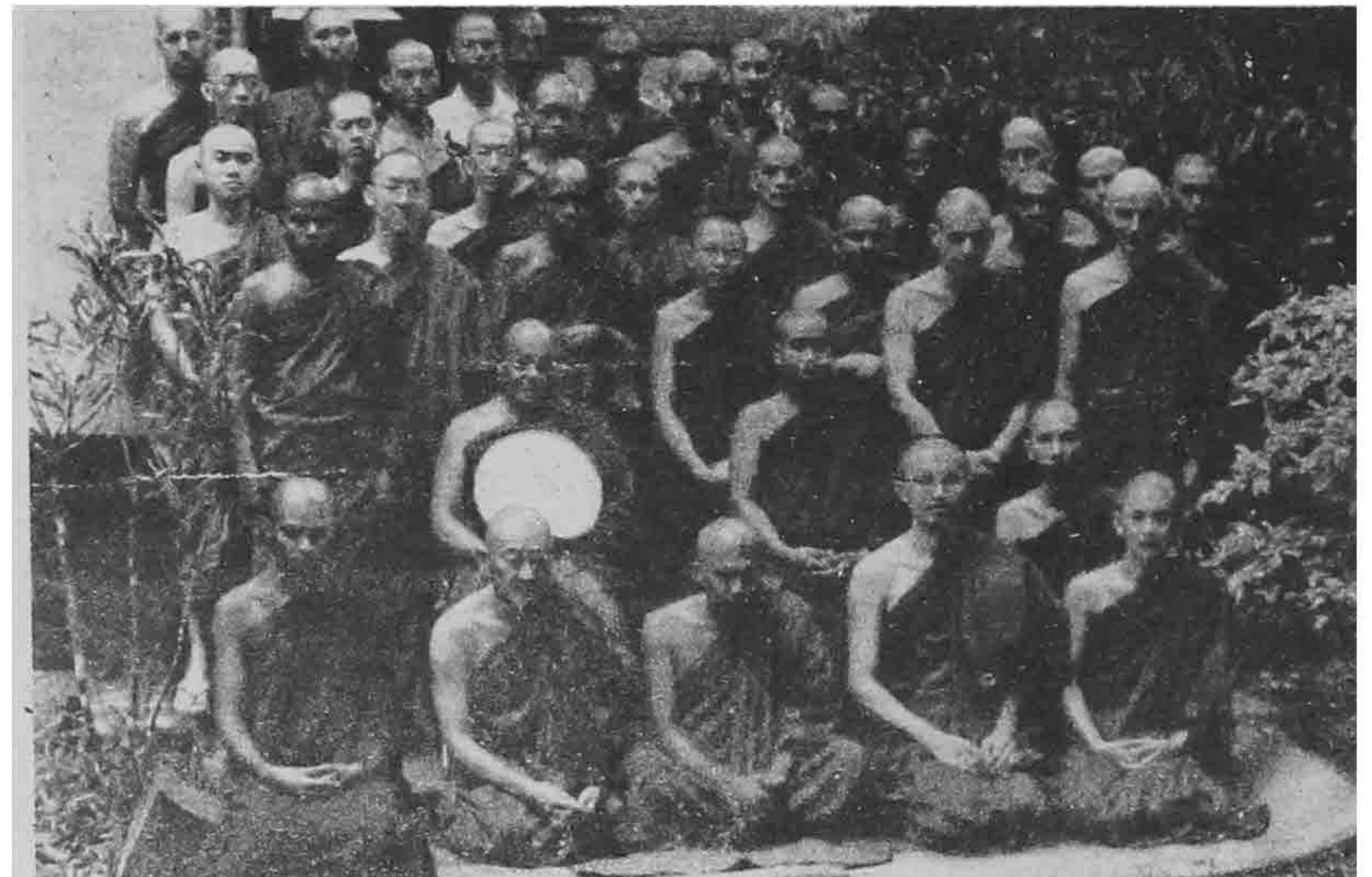
ဖားအောက်တောရဆရာတော်နှင့် နိုင်ငံခြားသားရဟန်းယောဂီများ

မြတ်ဗုဒ္ဓအလိုတော်ကျ - ဗုဒ္ဓဝါဒလမ်းစဉ်ကို ပီပီပြင်ပြင် ထုတ်ဖော်ညွှန်ပြ ထားသည့် မဇ္ဈိမပဋိပဒါကျင့်စဉ်ကို ဖားအောက်တောရ တွင် အားရဝမ်းသာ မြန်မကြာ ရှုပွားကြပါကုန်လော့။