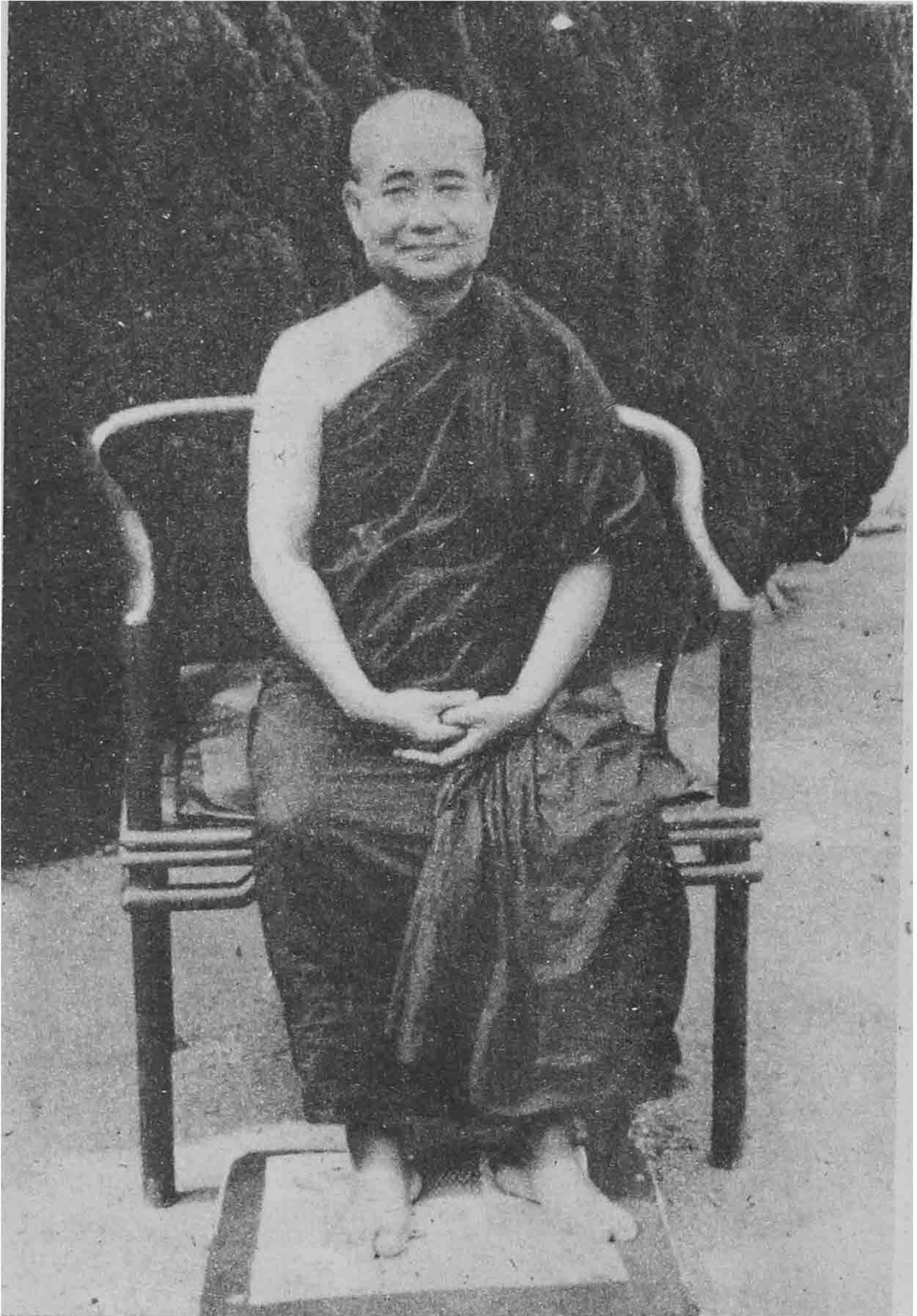
ဖားအောက်တောရဆရာတော်ဘုရားကြီး