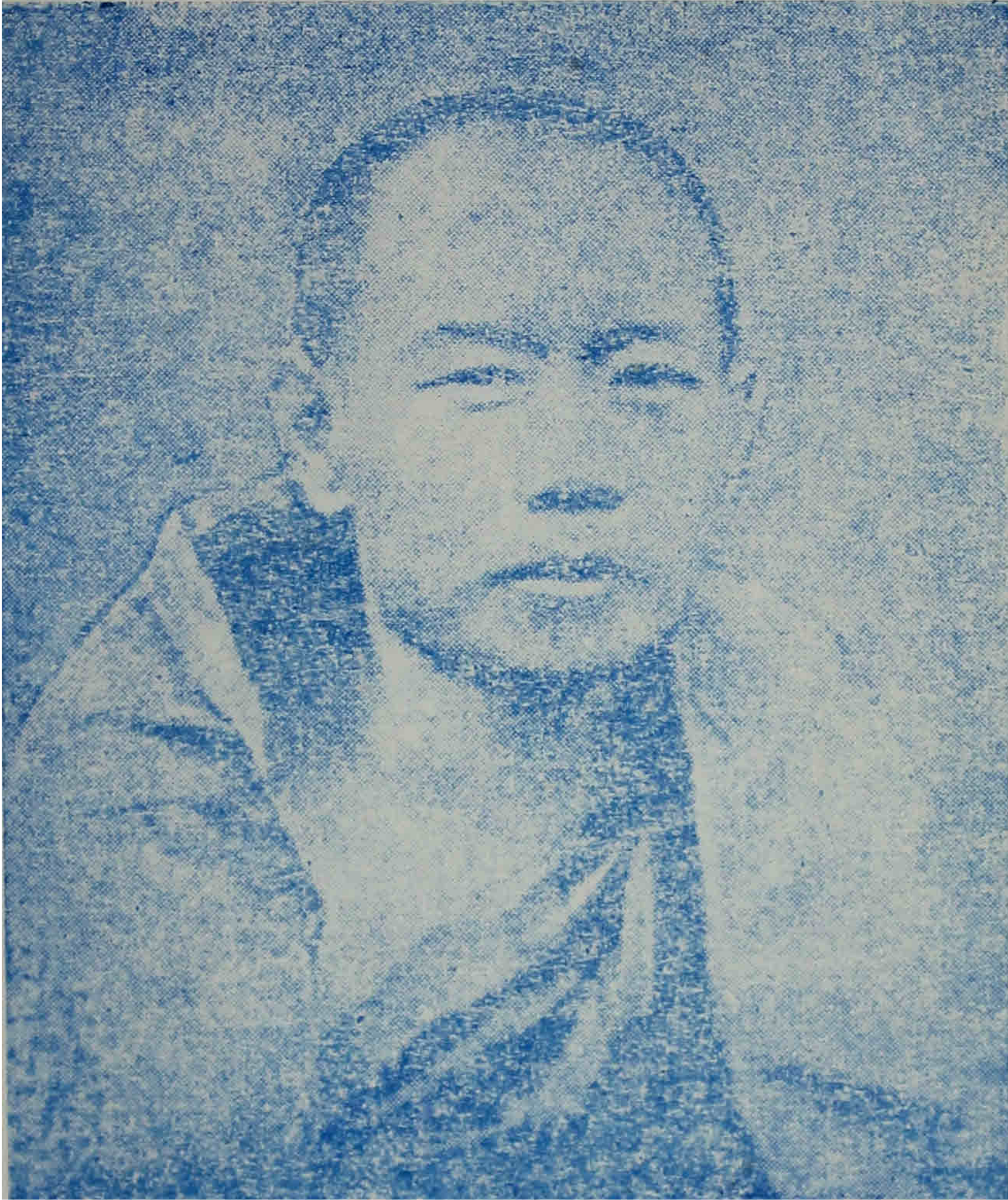
ပဌပ ဓမ္မနာဒ ဆရာတော် ဦးပညာသက္ကမထေရ် ပုံတော် (ခေါ်ပုံ ရှိက်ကု သောနယ် ၁၂၉၂-ခု)