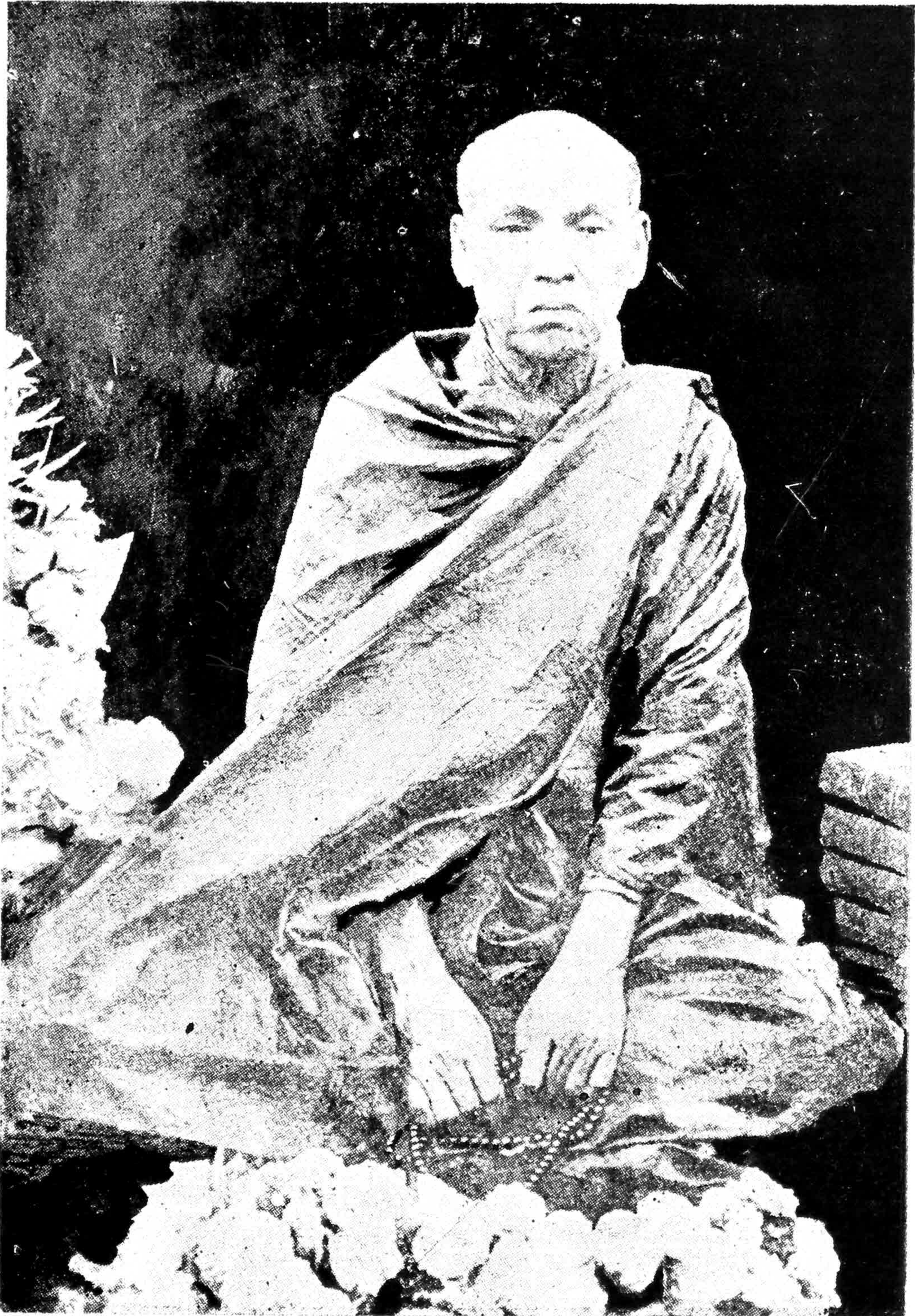
ကျေးဇူးရှင် လယ်တီဆရာတော်ဘုရားကြီး ပုံတော်