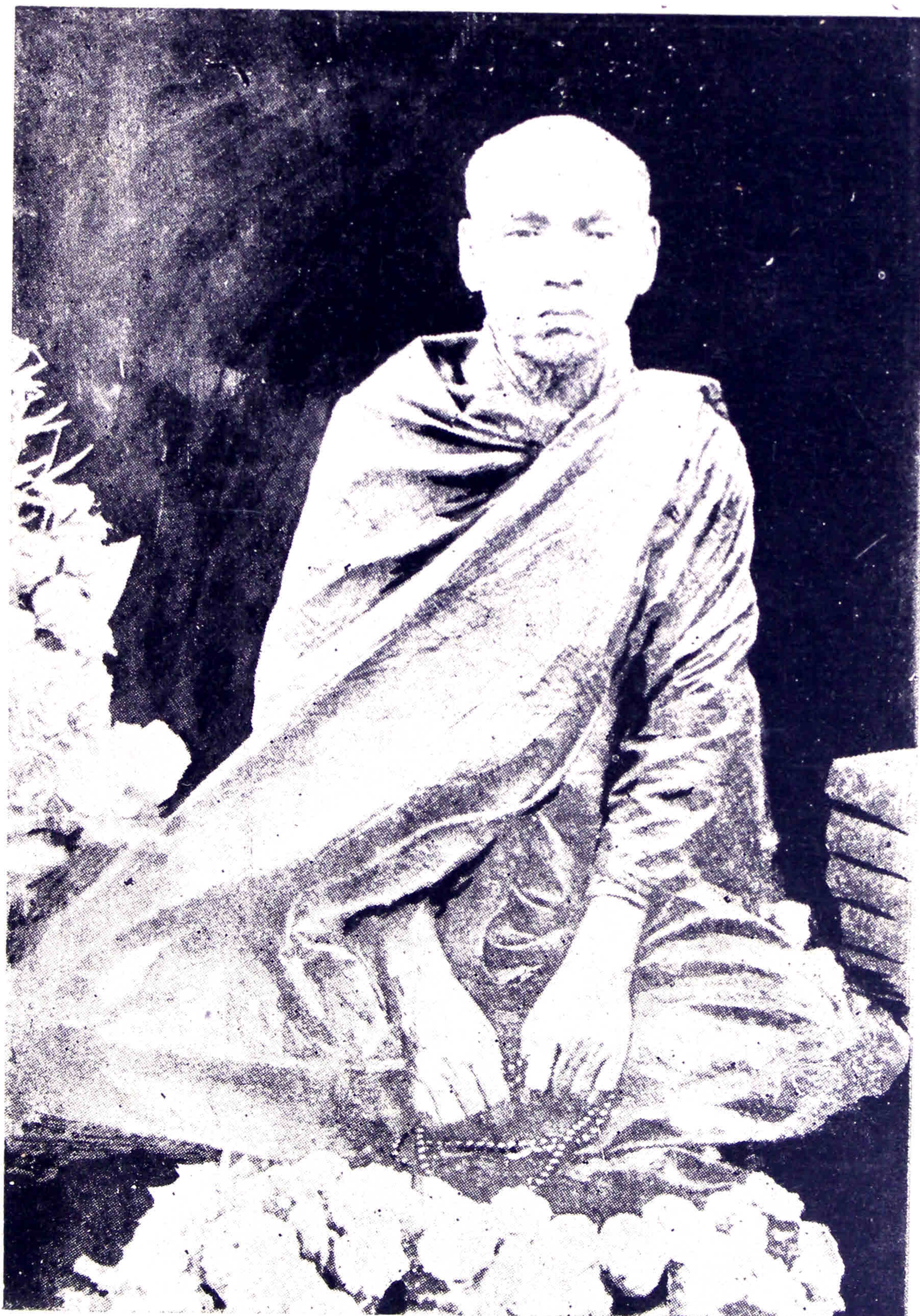
ကျေးဇူးရှင် လယ်တီဆရာတော်ဘုရားကြီး ပုံတော်